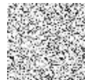
Tab. 2: Přehled celkové potřeby sadebního materiálu pro celý projekt