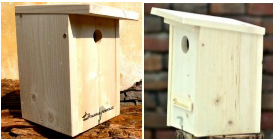
Obr. 1: Vlevo sýkorník, vpravo špačkovník

Budky dvou různých typů jsou navrženy na umístění na řešené plochy na již vzrostlé dřeviny (musí být umístěny pouze na stromy rostoucí na pozemcích ÚSES – s větší pravděpodobností nebudou káceny). Ptačí budky budou řešeny nákupem hotových produktů a budou pouze pověšeny dle uvedených pravidel. Ve všech případech bude použita ptačí budka opatřená dvojitým ochranným nátěrem a stříškou chráněnou lepenkou. Ke stromu budou všechny budky přivázány dvěma vázacími dráty provlečenými zadní stranou budky (vázací drát o průměru 3mm). Umístěny budou (kromě poštolčníků – kde požadujeme upevnění do co nejvyšší výšky) do výšky minimálně 4m nad zemí na řešených plochách pokud možno rovnoměrně.