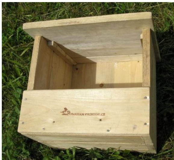
Obr. 2: Poštolečník

vletový otvor 34mm. Pět kusů špačkovníků bude mít rozměr dna min. 15x15cm, hloubku dutiny min. 25-30cm a průměr vletového otvoru 45-50mm.