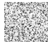
Tab. 8: Přehled sadebního materiálu v SO-03